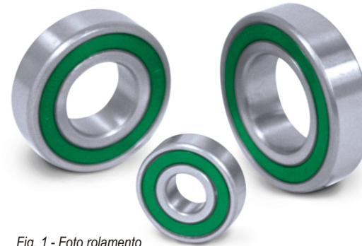
Fig. 1 - Foto rolamento série SS6, SS60 e SS62